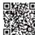
График работы и расположение пунктов очного голосования в Приложении 2 к распоряжению.

Распоряжение от 13.10.2023 г. № 135 - ро, опубликовано на сайте администрации МГП https://www.admmag.ru/