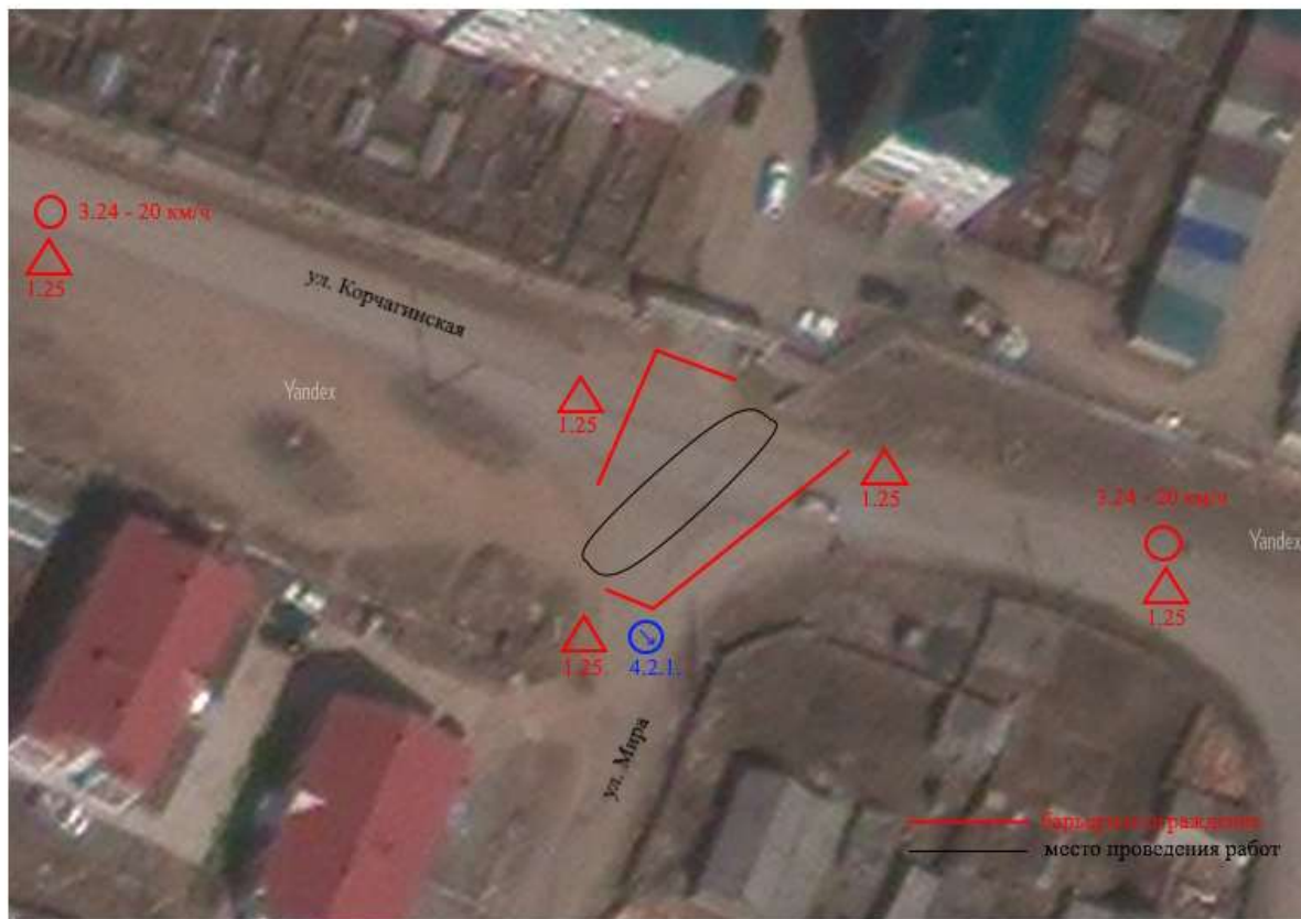
СХЕМА ОРГАНИЗАЦИИ ДОРОЖНОГО ДВИЖЕНИЯ и ограждения места производства работ по ул. Корчагинская в р.п. Магистральнинский

Орган издания: Администрация Магистральнинского городского поселения. Иркутская область, Казачинско-Ленский район, п. Магистральнинский, ул. Российская, 5. Извлечение из Закона печати: ст. 12 «Освобождение от регистрации»